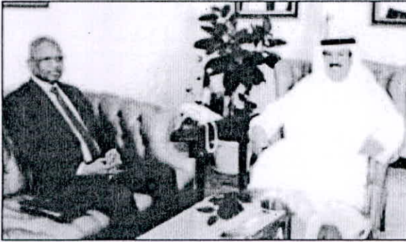
المصنف يستقبل سفير جزر القمر

استقبل مديرعام الهيئة العامة للتعليم التطبيقي والتدريب الدكتورعلي المصنف، في مكتبه بديوان عام الهيئة بالعدلية أمس، سفير جمهورية جزر القمر المتحدة لدى الكويت الدكتور العارف سيد حسن. وتم خلال اللقاء الحديث حول موضوعات عدة ذات الاهتمام المشترك في مجال التعليم، وبحث سبل توطيد التعاون الأكاديمي بين الهيئة وجمهورية جزر القمر، بالإضافة إلى مناقشة إمكانية الحصول على المنح الدراسية لطلبة جزر القمر من قبل الهيئة. وتقدم السفير حسن بالشكر الجزيل لمديرعام الهيئة، على حفاوة الاستقبال والضيافة، أملاً في تحقيق المزيد من التعاون والشراكة بين الجانبين.