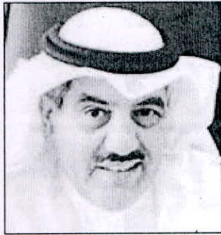
• عدنان العلي

قرر نائب المدير العام للتعليم التطبيقي والبحوث د. عدنان العلي استمرار عمل لجان الأقسام العلمية وكليات الهيئة خلال الفصل الدراسي الصيفي. وقال خلال كتابه إلى عمداء الكليات أنه بناء على قرار لجنة الشؤون العلمية بالموافقة على انعقاد اللجان العامة في الأقسام العلمية والكليات خلال الفصل الدراسي الصيفي وذلك وفق أن يكون جميع أعضاء اللجان مكلفين بالفصل الصيفي وانعقاد اللجان خلال فترة الفصل الصيفي المبيته في التقويم الخاص بكليات الهيئة. والنظر في الموضوعات المدرجة على جدول أعمال اللجان وتسيير العاجل من الأمور، والالتزام بلائحة النظم وإجراءات العمل في الأقسام العلمية.