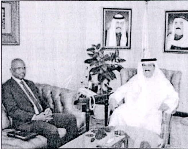
• علي المضيف مستقبلاً سفير جزر القمر

استقبل المدير العام للهيئة العامة للتعليم التطبيقي والتدريب علي المضيف أمس بمكتبه بديوان عام الهيئة بالعدلية سفير جمهورية جزر القمر المتحدة لدى الكويت العارف سيد حسن.